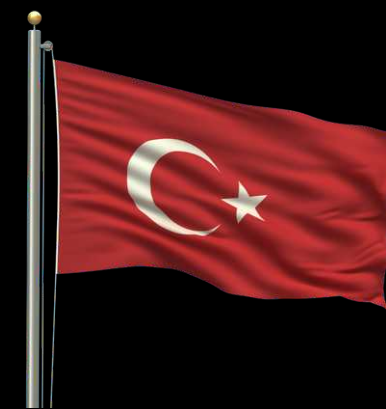
Pays invité : Turquie