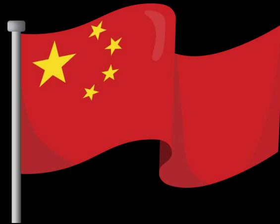
Pays d'honneur: CHINE