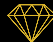
Awards des mines