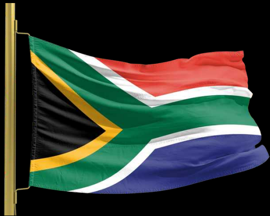
Pays invité : Afrique du Sud