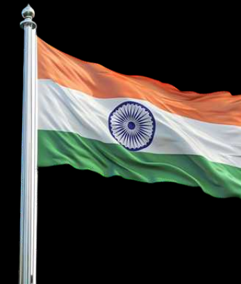
Pays invité : Inde

“Présence d’investisseurs et institutions internationales”