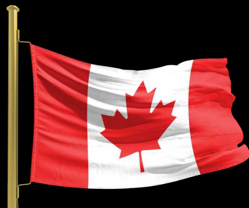
Pays invité : Canada