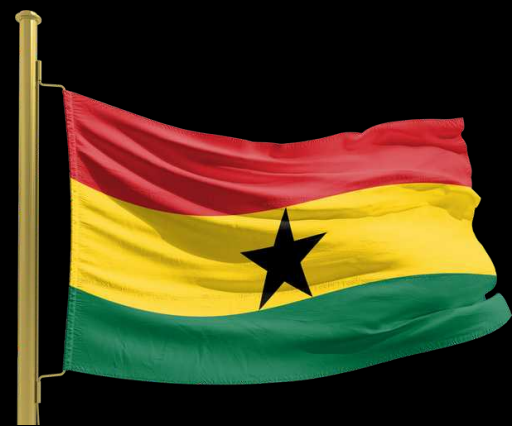
Pays invité : Ghana